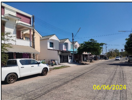
ทิศเหนือ