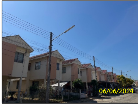
ลักษณะหน่วยพักอาศัย