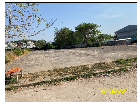
ลานร้านค้าชุมชน