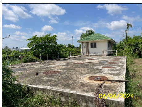
ระบบบำบัดน้ำเสีย