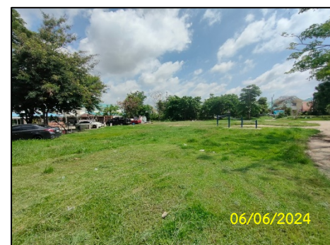
พื้นที่สวนสาธารณะ