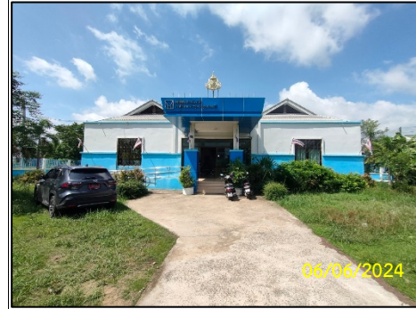
อาคารศูนย์ชุมชน